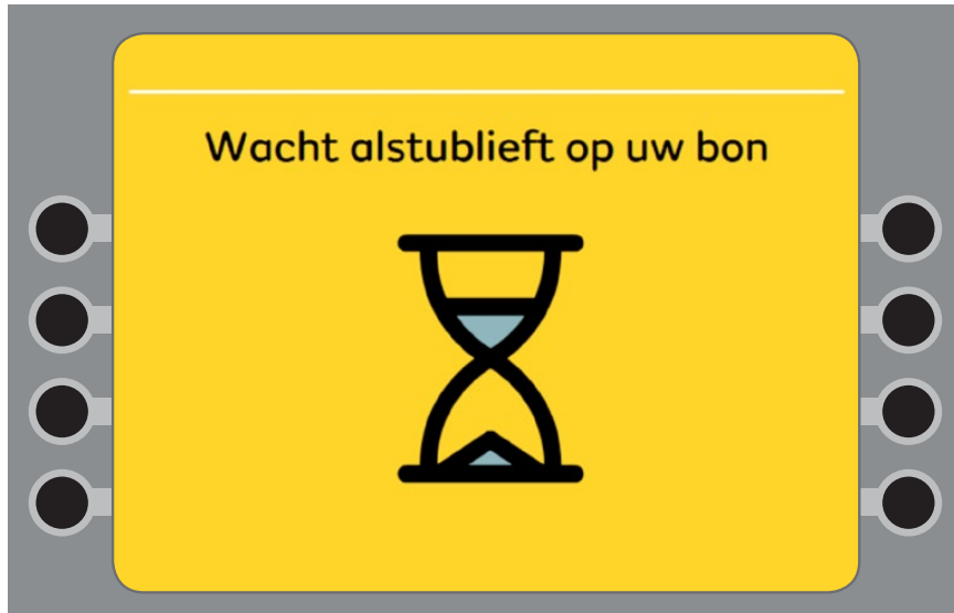
Even wachten. De automaat print uw bon.