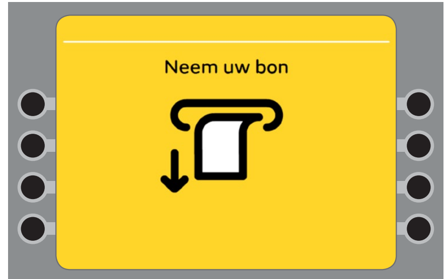
Uw bon is klaar. U kunt uw bon uit de automaat pakken.