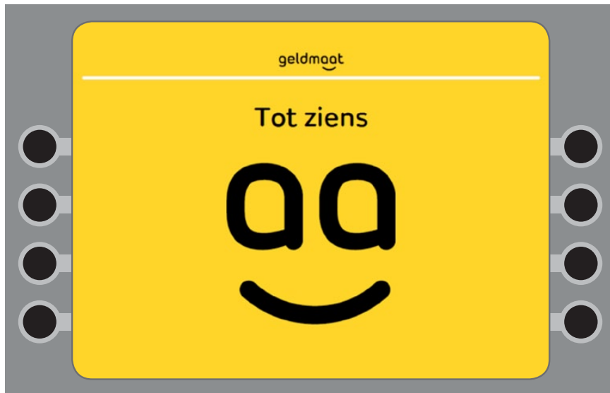
U bent klaar. Graag tot ziens.